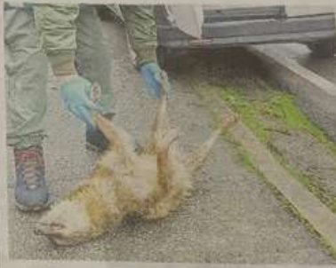
Lo sciacallo dorato recuperato nella Bassa dopo essere stato investito